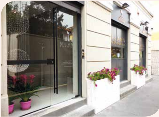
Via Muzio, 1/D