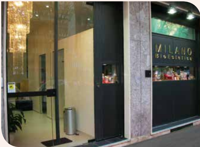
Via Teodosio, 27